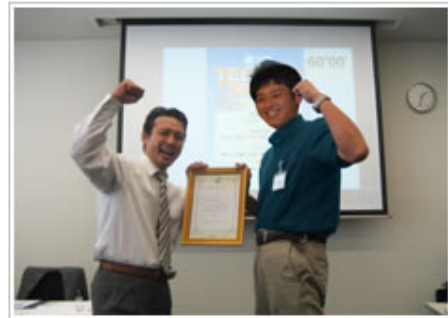
目標達成者への表彰式

「人づくり」をすることが、会社の活性化に繋がっていくのではないかと、当社は考えています。