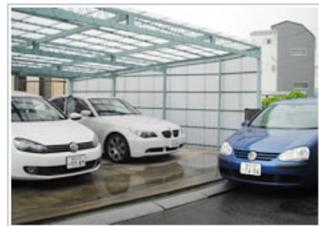
お客様車両納車式