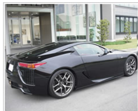
新型車(未発表)商品の確認